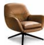
6 JENSEN POLTRONA CM 81X85 H78