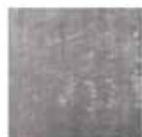
7 DIBBETS TAPPETO CM 400X300